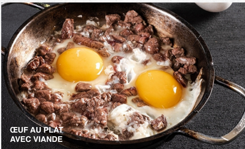
ŒUF AU PLAT AVEC VIANDE